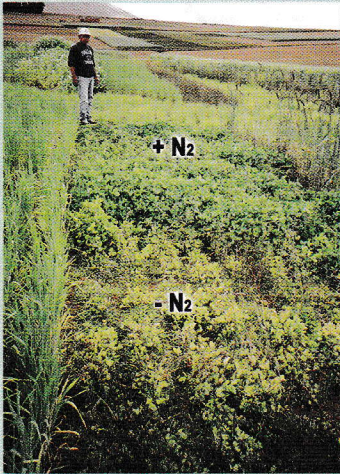
Ensayos en Rodeo (Arani, Cochabamba) con trébol rojo con y sin inoculante