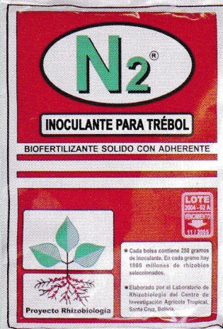
Inoculante N 2 para trébol

El inoculante es una fuente fertilizante natural. Se aplica al momento de la siembra y sirve para que la planta tome nitrógeno del aire y lo deje en el suelo, lo cual mejora las condiciones de éste. Su costo es mínimo en comparación a los fertilizantes químicos.