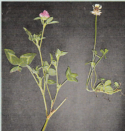
Diferencias entre el trébol rojo (izquierda) y trébol blanco (derecha)

El inoculante es una fuente fertilizante natural. Se aplica al momento de la siembra y sirve para que la planta tome nitrógeno del aire y lo deje en el suelo, lo cual mejora las condiciones de éste. Su costo es mínimo en comparación a los fertilizantes químicos.