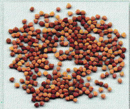
Semilla de trébol blanco (peso de 1000 semillas: 0.8 gramos)