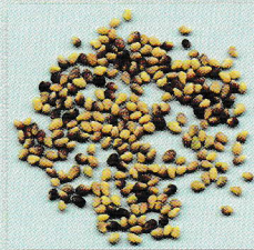
Semilla de trébol rojo (peso de 1000 semillas: 1.8 gramos)